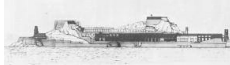
1. Διπλωματική εργασία - Η πόλη της Κέρκυρας 2. Διπλωματική εργασία - Η πόλη της Καβάλλας 3. Σχεδιασμός 4 πλατειών στην πόλη της Ρόδου, 1991

Το αποτύπωμα του έργου τους στη σύγχρονη ελληνική αρχιτεκτονική, αν και μικρής κλίμακας προς το παρόν, είναι ιδιόρρυθμο και κατατάσσεται δύσκολα σε υπάρχουσες κατηγορίες. Εντάσσεται κατ’ αρχήν σε ένα σύνολο αξιολογών πραγματοποιήσεων, που καταγράφονται στο γεωγραφικό χώρο της Κρήτης από τη δεκαετία του ‘90 και μετά, από μια ομάδα αρχιτεκτόνων από διαφορετικές γενιές και με διαφορετικές ιδιοσυγκρασίες, αλλά με κοινό χαρακτηριστικό μια γυμνή και άμεση γραφή που ανταποκρίνεται στα τοπικά ερεθίσματα και τις ανάγκες μιας ευαίσθητοποιημένης πελατείας. 9