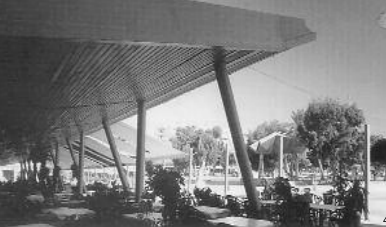
4. Πλατεία Ελευθερίας στο Ηράκλειο, 1993 5. Μνημείο της Δαμάσας, 1994