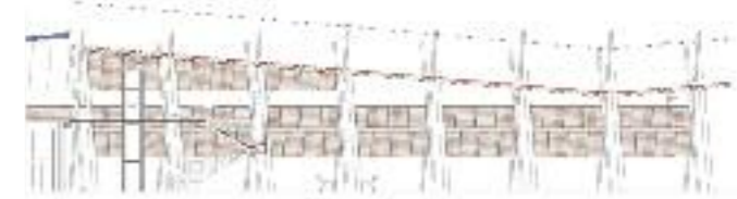
19. Μελέτη ανάπλασης του συγκροτήματος της Περιφερειακής αγοράς Χανίων, 2006 - 09